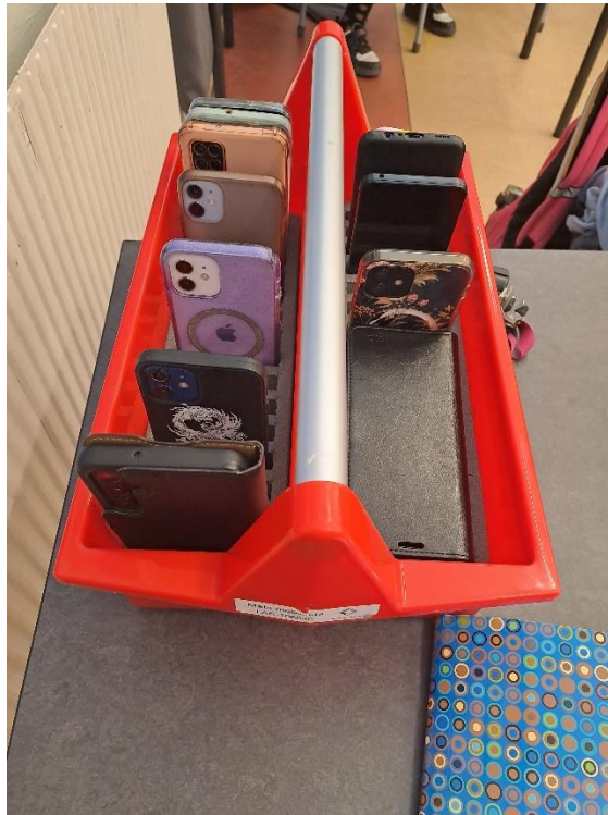
Zastori za samostojno delo in škatla za mobilne telefone ob vstopu v razred