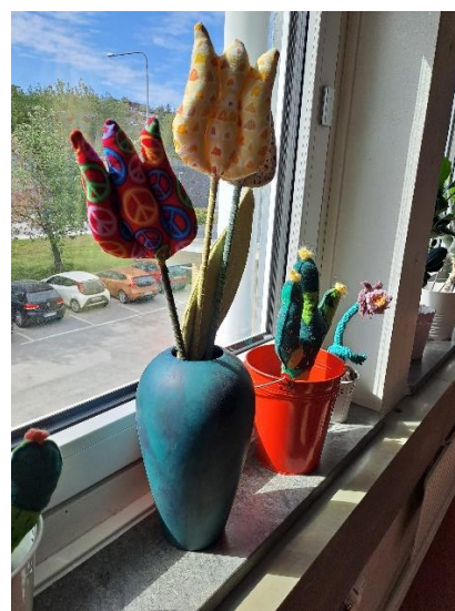
»Sešit« zajtrk in cvetje, ki ne potrebuje vode