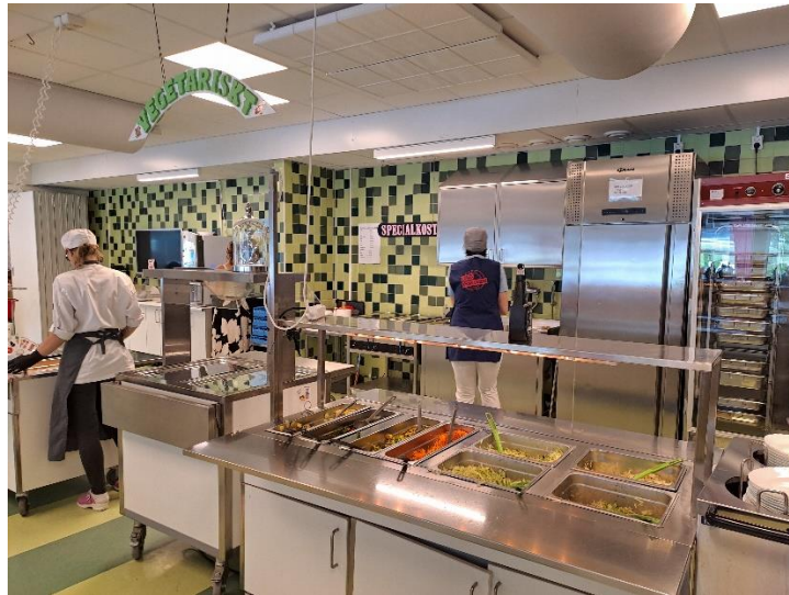
Bogata ponudba kosil