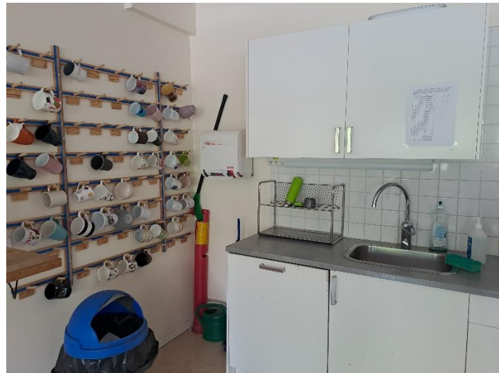
Prostor za druženje in počitek učiteljev

Imajo tudi zdravstveno ambulanto, kjer medicinska sestra poskrbi za jemanje zdravil ali zgolj dajanje protibolečinskih tablet. Nanjo pa se obračajo tudi, če imajo kakršnekoli stiske povezane s šolo ali domom.