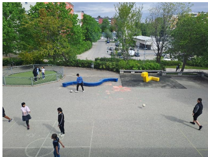
Mini igrišče in ploščad pred šolo