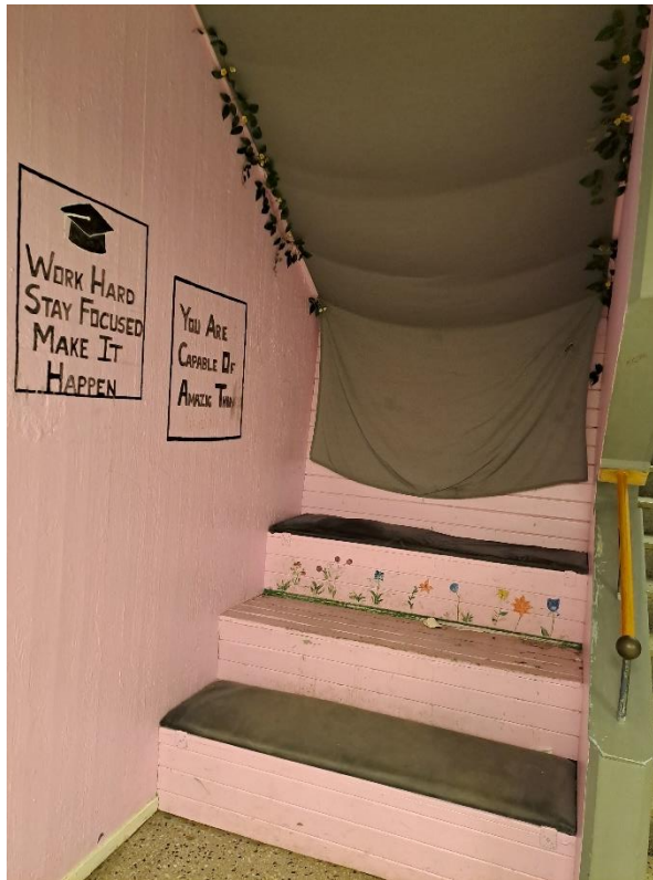
Kotički za »umik«