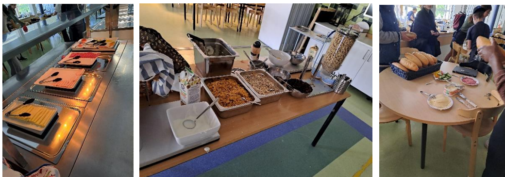
Bogata ponudba zajtrka in priprava »lunch paketa«

je ena od stvari, ki me je še posebej navdušila. Od leta 2022 učencem poleg brezplačnega kosila nudijo tudi zajtk, ki je na voljo v jedilnici od 7.30 dalje do pričetka pouka. Če učenci kakšen dan oddidejo na dan dejavnosti izven šole, si zjutraj sami pripravijo sendvič, ki nadomesti kosilo.