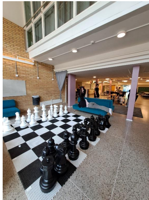
Aktivno preživljanje odmorov

Šola je stara 52 let, kar se na sami zgradbi že pozna, je pa zato notranja oprema toliko sodobnejša. Imajo lastno kuhinjo, veliko jedilnico, knjižnico in prenovljeno športno dvorano, ki učencem omogoča spoznavanje praktično vseh športov.