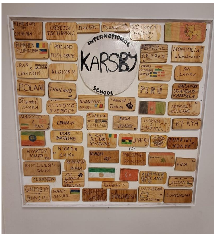
Vse nacionalnosti na šoli

je oddaljena dobre pol ure vožnje z metrojem od središča Stocholma, sredi blokovega naselja, kjer živi večina priseljencev iz različnih držav sveta. Temu primerna je tudi struktura otrok, ki obiskujejo šolo. Na šoli je 420 učencev iz več kot tridesetih držav, Švedov skoraj ni, tudi med učitelji jih je le peščica, večinoma v administraciji.