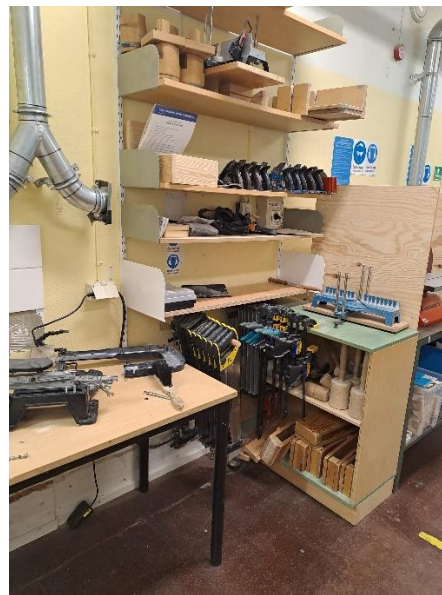
Učilnica za obdelavo lesa

Enako pozornost posvečajo tudi šivanju, s katerim poleg spretnosti razvijajo tudi ustvarjalnost. Vsaka šolska klop ima dvížni šivalni stroj, blaga in drugih pripomočkov ne manjka in izdelki učencev so res navdihujoči.